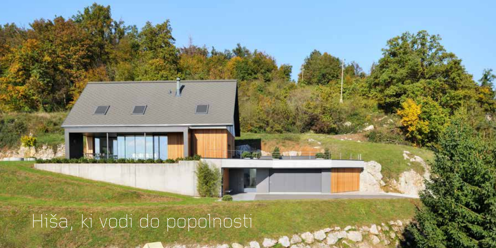
Hiša, ki vodi do popolnosti

Če bi bil hedonizem film, bi bil arhitekt njegov režiser, scenograf, igralec in hkrati gledalec. Strast do kreiranja zgodbe, vpete med topografske plasti lokacije, taktilnost izbranih gradiv in prepletenost življenjskih spon njenih bodočih prebivalcev, postane skorajda odvisnost. Začarani krog poganja, ustvarjanja, ugajanja in izzivanja. V vseh elementih pa hoja po robu za doseganje skrajnih presežnih vrednosti. In vse z enim samim namenom. Ustvariti popolnost in v njej uživati. Kakor voajer, ki od daleč opreza za svojim plenom.